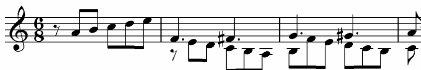
Suite No 2 para Laúd en Am, J. S. Bach

Esta imitación respeta la dirección del antecedente, pero no su contorno, es decir, que aquellos gestos melódicos que en el antecedente fueron ascendentes, son imitados descendentes y viceversa. Para lograr una transposición exacta de los intervallos del antecedente en el consecuente, se utiliza una escala cruzada, elaborada a partir de las notas del tritono, esta escala es aplicable a todos los modos y tonalidades mayores y menores 2 .