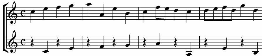
Theodore Dubois. Contrapunto.

Esta imitación interrumpe los todos valores rítmicos del antecedente con silencios de la misma duración.