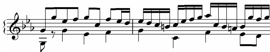
Fuga 2 a cuatro voces. Libro II, Clave bien temperado. J. S. Bach

Esta imitación generalmente respeta la dirección y el contorno del antecedente, sin embargo, altera la duración de las figuras rítmicas del antecedente duplicando su valor a su equivalente.