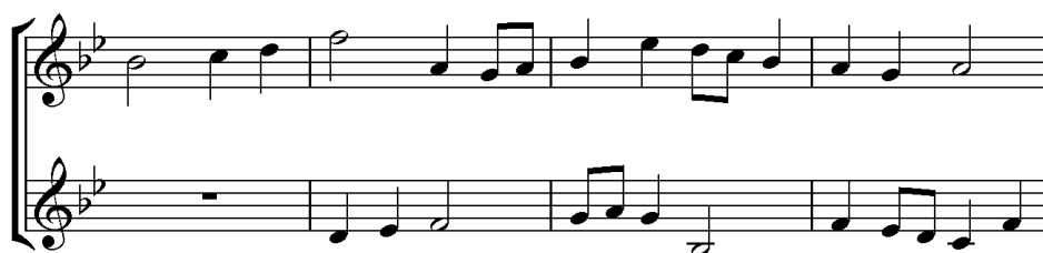
Imitación retrogrado-contraria, Theodore Dubois. Contrapunto.

Esta imitación cambia la dirección del antecedente, pero no su contorno, es decir, el consecuente inicia con el último sonido del antecedente y termina con el primero del mismo (espejo), igualmente, es posible hacer una imitación retrógrada sobre la imitación contraria del antecedente, a esta imitación se le dio el nombre de imitación retrogrado-contraria, o cangrejo.