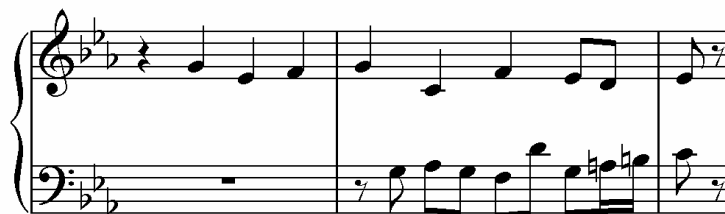
Imitación contraria por disminución. Fuga 2, libro II. El Clave bien temperado. J. S. Bach

Esta imitación generalmente respeta la dirección y el contorno del antecedente, sin embargo, altera la duración de las figuras rítmicas del antecedente reduciendo su valor a su mitad equivalente.